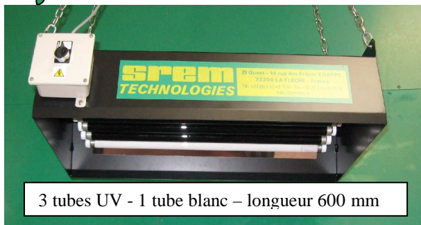
3 tubes UV - 1 tube blanc – longueur 600 mm